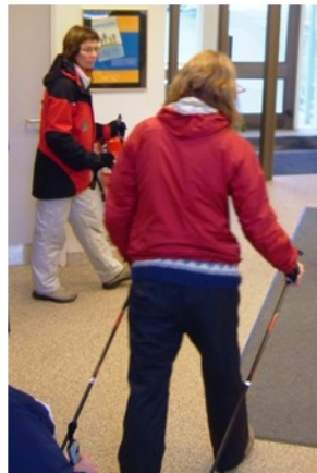
Hanna að læra stafgöngu