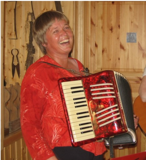
Marrit með tónleika í vorferð